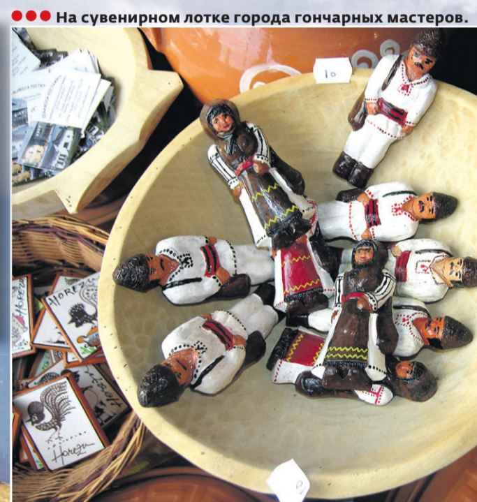
●●● На сувенирном лотке города гончарных мастеров.