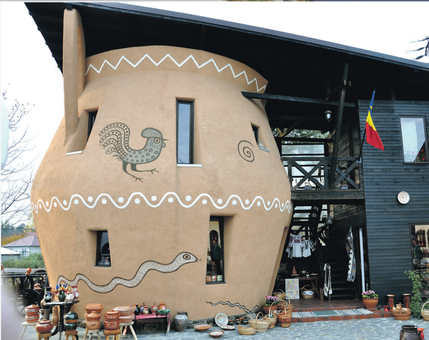
●●● «Горшочек» с двухэтажный дом - сувенирная лавка в Хорезу.