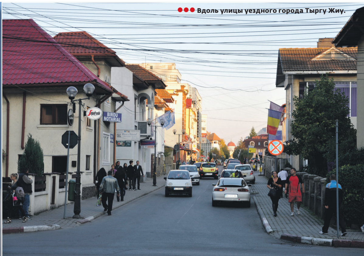
●●● Вдоль улицы уездного города Тыргу Жиу.

зидентском государстве, то в целом итоги последних лет выглядят многообещающе. Хотя, конечно, процесс реформ мог бы проходить по-эффектнее, коррупция - менее масштабной, а достижения, в том числе и в Евросоюзе - более осязаемыми. Впрочем, как известно, без такой критики не обходится ни одно государство, имеющее мало-мальски вразумительную политическую оппозицию... Вот и конфликтуют правящие круги в Бухаресте, перекладывая вину и ответственность друг на друга.