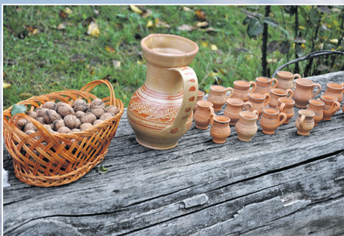
●●● А по маленьким кувшинчикам-рюмочкам разливают палинку...