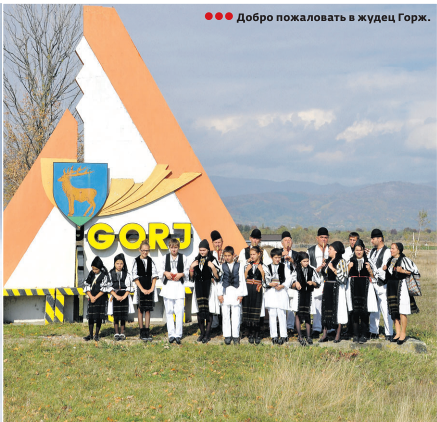
●●● Добро пожаловать в жудец Горж.